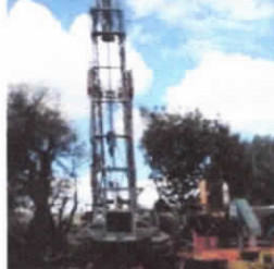
Se concluyeron los trabajos de perforación del pozo y se solo se espera que llegue la tubería para proceder a su instalación. Llegando la tubería se puede pr...