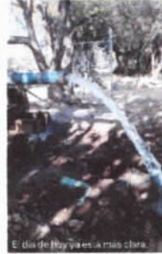
El día de hoy va en la más clara...