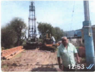
Visitando las obras de perforación de reposición del pozo de agua potable del pueblo

5.- A PARTIR DEL DIA DE 18 DE OCTUBRE 2021 SUPERVISIÓN DE LA OBRA PARA SUSTITUCIÓN DEL POZO DE AGUA POTABLE "LA VEGA" LOCALIZADO EN SAN JUAN SOLIS HGO, CON VISITAS SEMANALES DESDE EL INICIO DE LA OBRA HASTA QUE SE TERMINO LA PERFORACIÓN Y TODO PARA EL ENTALLAMIENTO, DEJANDO LISTO PARA LA CONECCIÓN DE LA BOMBA DE SUCCIÓN NECESARIA. CON AFORO HIDRÁULICO DE 38 LITROS X MIN. HASTA LA CULMINACIÓN DE ESTA ETAPA. LUNES 6 DE DICIEMBRE 2021.